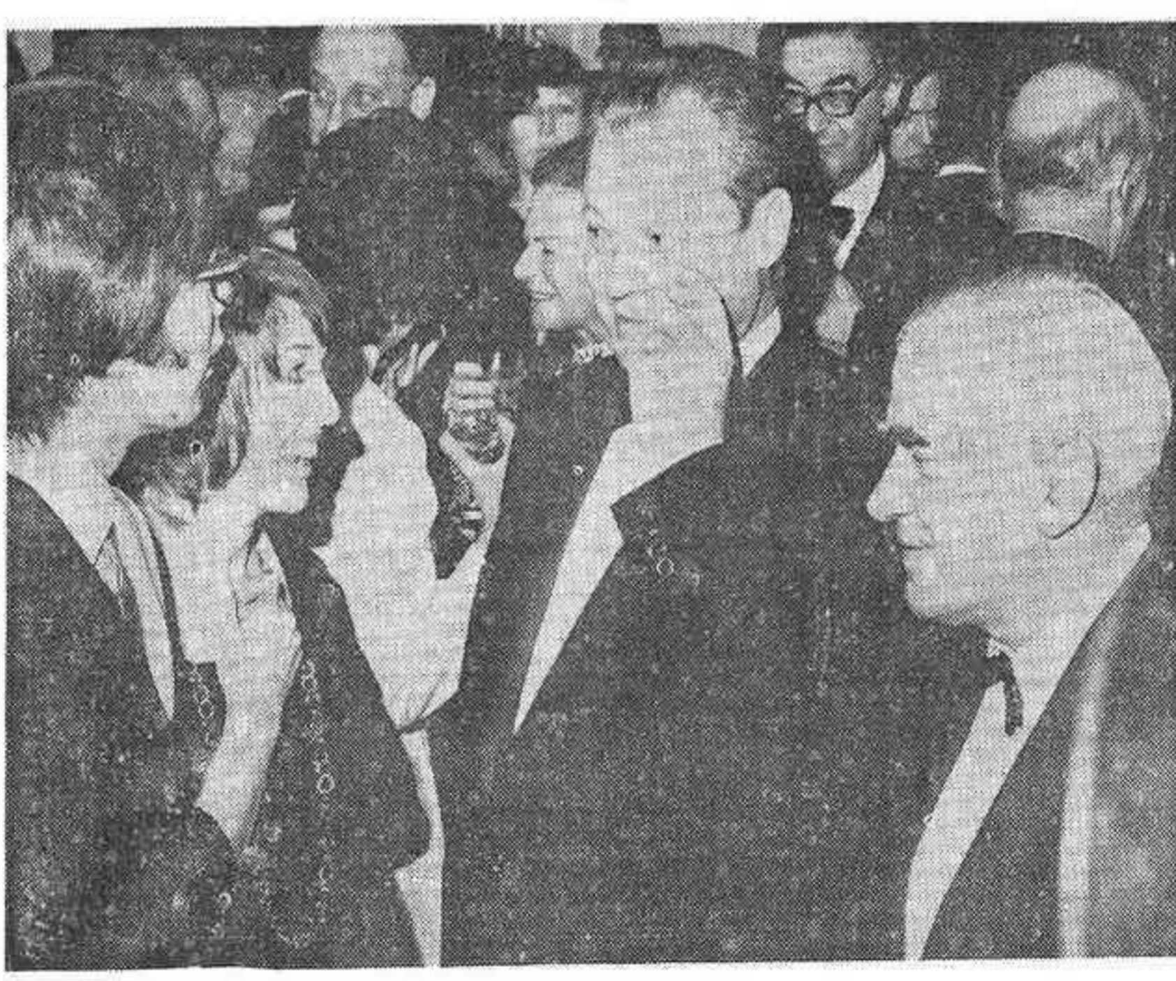
LONDRES. — El canciller de la República Alemana, Willy Brandt, reafirmó, en Londres, su completo apoyo a la petición de ingreso de Gran Bretaña en el Mercado Común. En la foto aparece Brandt, en la foto, el canciller alemán char. con la estrella "pop", Cliff Richard y Una Stubbs, durante la recepción celebrada en el número 10 de Downing Street. A la derecha, el secretario del Foreign Office, Michael Stewart