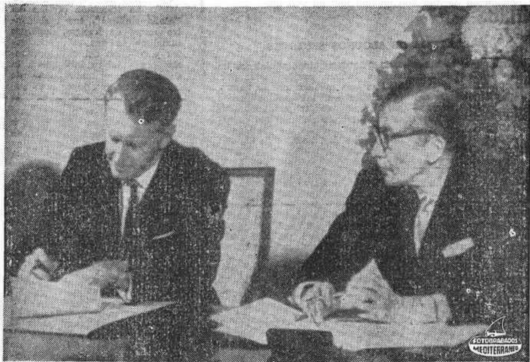
SALISBURY (Rhodesia). — El Primer Ministro Ian Smith (izq.) firma el decreto que convierte a Rhodesia en República. A la derecha el Presidente Clifford Dupont. Hace cuatro años que el país se autoproclamó independiente.

Se pretende el bloqueo internacional al reconocimiento de la nueva República