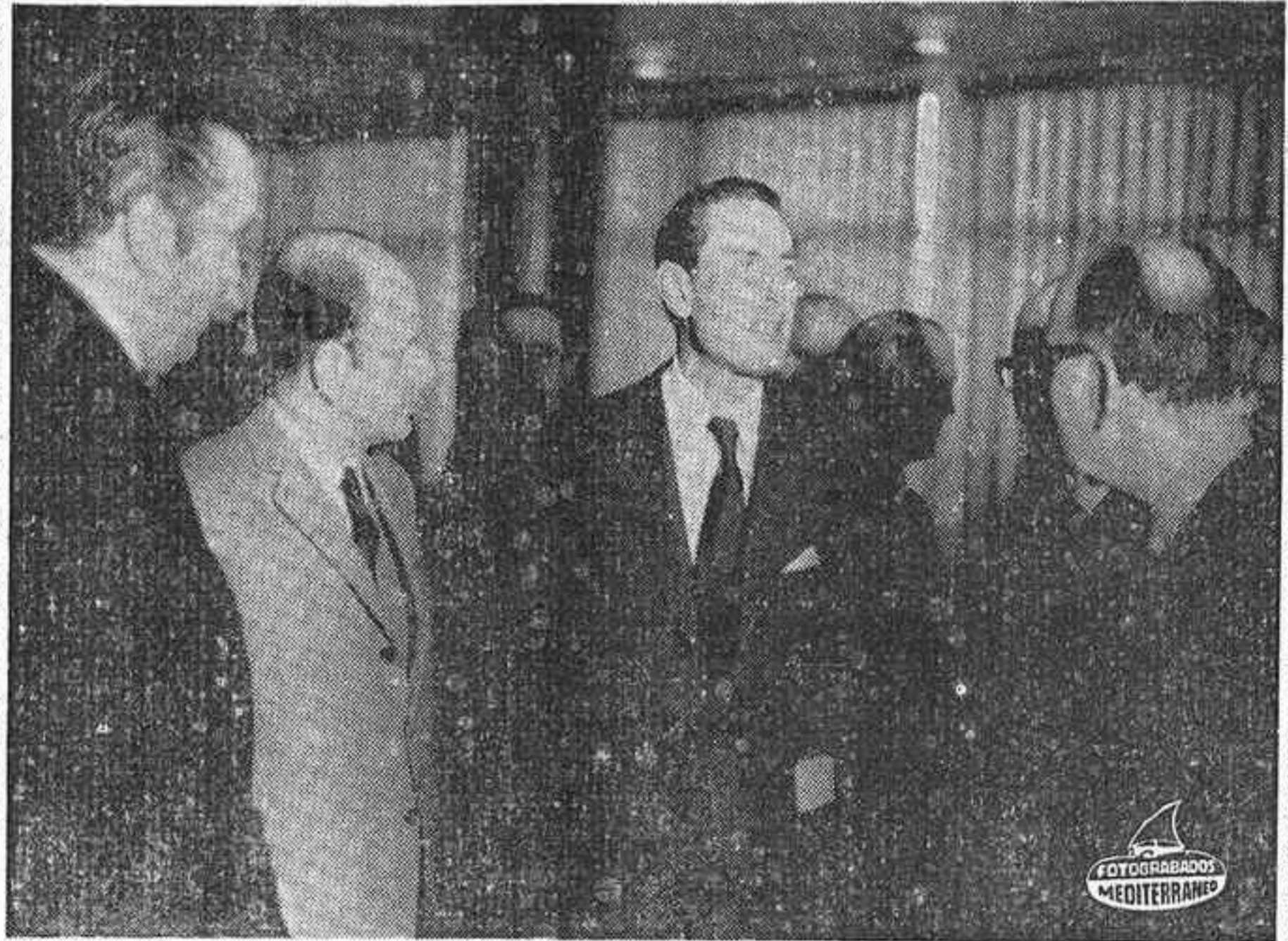
BOGOTÁ.— El Ministro de Comercio español, D. Enrique Fontana Codina, de visita oficial a Colombia al final de la cual firmará el nuevo convenio de intercambio comercial entre los dos países, fue recibido a su llegada a esta capital por el Embajador español Don Joaquín Juste y el Ministro de Desarrollo colombiano Don Hernando Gómez Otalora. En la fotografía, el Ministro español conversando con el de Desarrollo de Colombia, Don Hernando Gómez (der.) en presencia de altas personalidades del mundo político y comercial.