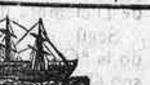
Alfonso XIII, 84