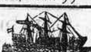
Alfonso XIII, 84