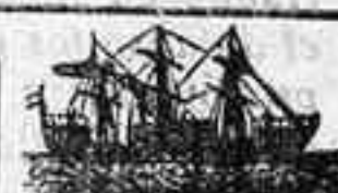
Alfonso XIII, núm. 35

Colección de 6 posiciones diferentes en 24 postales pesetas 18. “Photo-Art”, San Francisco 12.