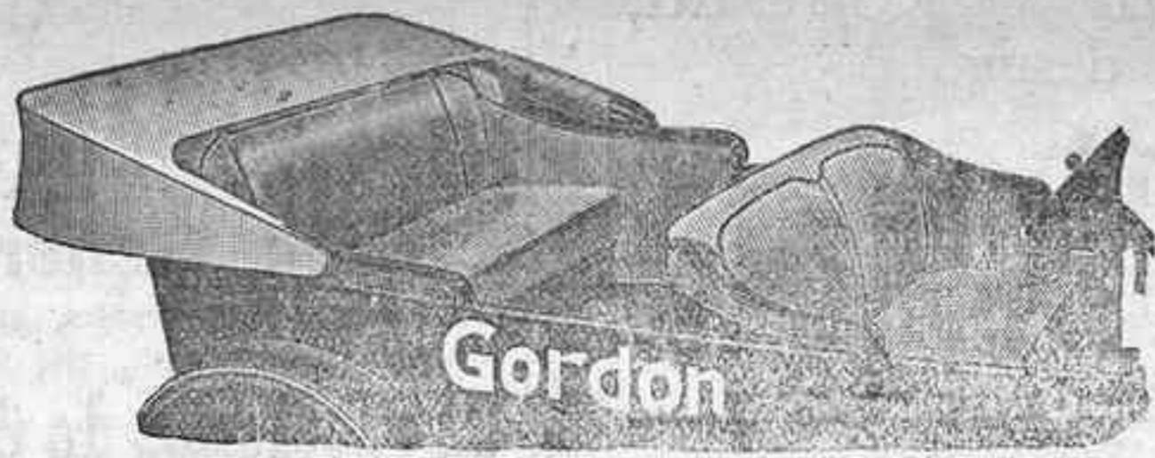
Haga que su auto viejo parezca nuevo! Mantenga siempre reluciente su auto nuevo!

Se acomodan fácilmente en todos los modelos de automóviles populares Cubren los cojines, Respaldos, las Portezuelas y las Piezas del frente. Capota y la Pieza para el lado posterior del Asiento del Frente, son extras. Se ajustan con Botones de Presión.