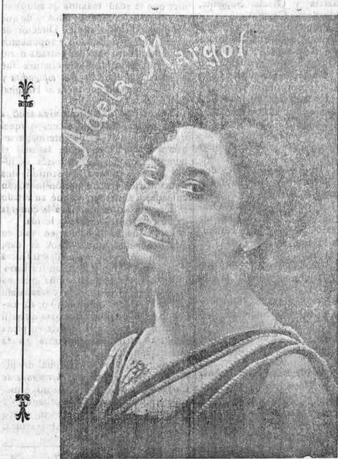
Notable artista de variedades, que esta noche celebra su función de beneficio en el Parque Recreativo.

«Don Julián» ha fondeado en Tacarón. Capitán hace dos días salió de a bordo. Piloto no quiere auxilio (sigue una palabra ininteligible). Lo que tengo el honor de trasladar a V. E. que como verá capitán del correo cumplió palabra de facilitar toda clase de auxilio al patibot «Don Julián».