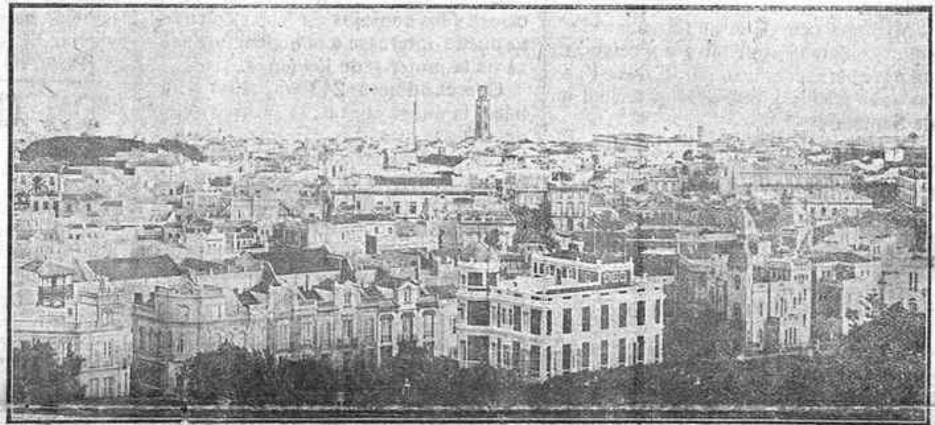
Vista panorámica de Santa Cruz de Tenerife tomada de la terraza del «Gran Hotel Quisisana». En primer término el «Barrio de los Hoteles». (Del «A B C de las Islas Canarias»)

Sin importancia y utilidad resalta con solo hojearla, pues contiene infinidad de grabados, informaciones públicas y comerciales, mapas,