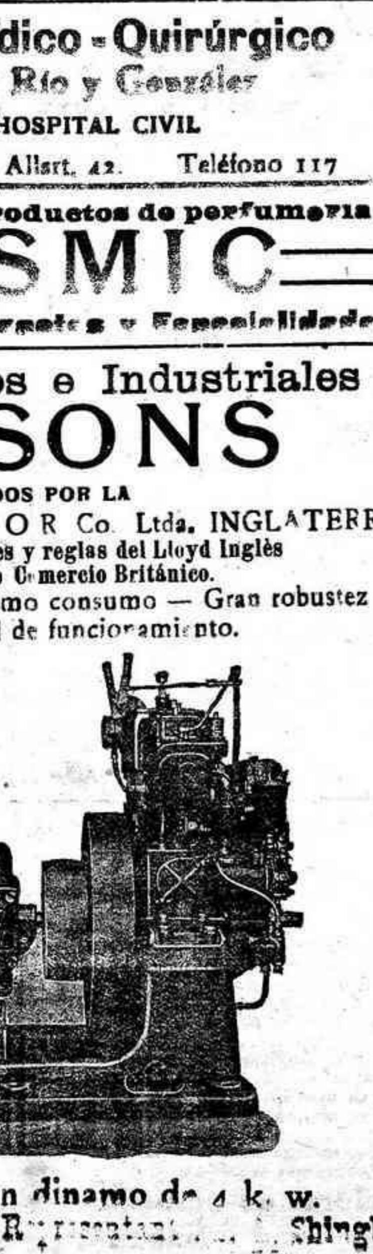
Motor de 7HP con dinamo de 4 k. w. Representación... Shingler

Motores Marinos e Industriales PARSONS FABRICADOS POR LA THE PARSONS MOTOR Co. Ltda. INGLATERRA Siguiendo las instrucciones y reglas del Lloyd Inglés y del Ministerio de Comercio Británico. Máximo rendimiento — Mínimo consumo — Gran robustez Absoluta seguridad de funcionamiento.