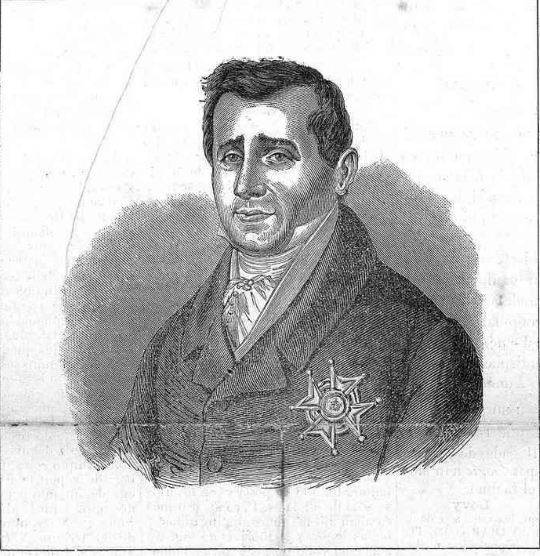
EL GENERAL DON FRANCISCO TOMÁS MORALES Nació en el Carrizal, en 1783. † el 5 de Octubre de 1845.

314 JULIO MARY Empezó desde entonces una vida muy tranquila para todos. Con mucha frecuencia se vé durante la buena estación que las mañanas son serenas y que en ellas la atmósfera está llena de balsámicos aromas, siendo su nota característica una calma que convida al descanso y á la confianza, sin que el más ligero soplo de viento que se deslice entre la hojas ni la más pequeña nubecilla hagan presumir que por la tarde puede estallar la tempestad y retumbar el trueno. Diana continuaba mostrándose muy cariñosa y sumisa, y para ella podía decirse que no había más voluntad que la de su hermana y rara vez salta del castillo. Habían destinado á las dos hermanas todo el segundo piso de Castelbone, pues Baltoli deseaba que pudiesen vivir con entera libertad y aislarse el día en que el aislamiento las pareciera un descanso. Esas habitaciones eran un espacioso salón, dos gabinetes con libros, en un rincón de una de las torres, desde la que se descubría un admirable panorama de montañas, y después los dos dormitorios juntos, porque Clara no habría que rido separarse de su hermana. Deseaba estar siempre á su lado para velar por ella hasta de noche. Bartoli encargó á Clara la dirección de la casa. —Aquí seréis soberana y señora, Clara—le dijo, y al hacerlo su voz temblaba á impulsos de una emoción misteriosa—hasta el día en que Diana recobre la razón. Ese día compartiréis con ella vuestro reino.