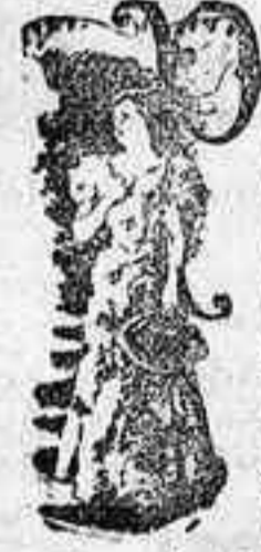
La falda como indica el figurín