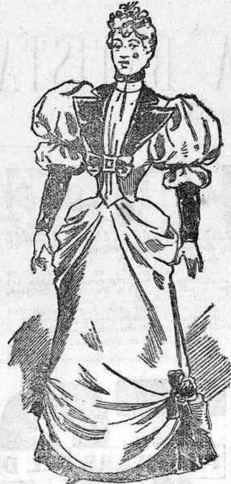
Vestido para recepción

Este elegantísimo traje de primavera se hace de seda bordada y se guarnece con terciopelos y azabaches. El cuerpo, que constituye un capricho Figaro sin costuras en la espalda, se abre en ancha y triangular solapa sobre un chaleco ligeramente fruncido en la parte que ajusta al talle y liso en lo que forma el cuello. Esté Figaro se sujeta por un broche lazo que parte bajo el pecho