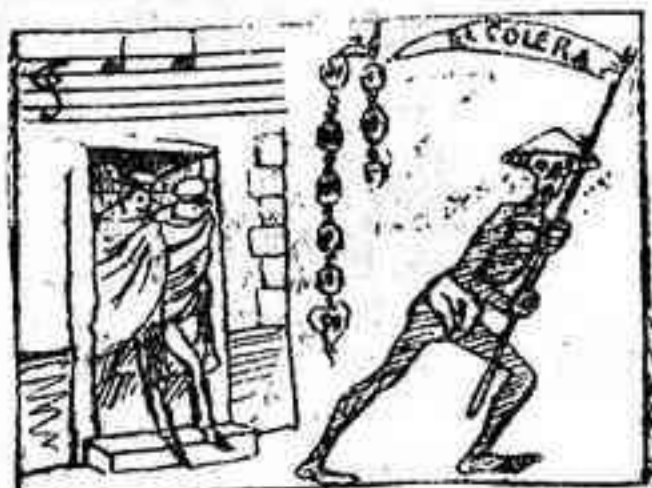
La solución, mañana.