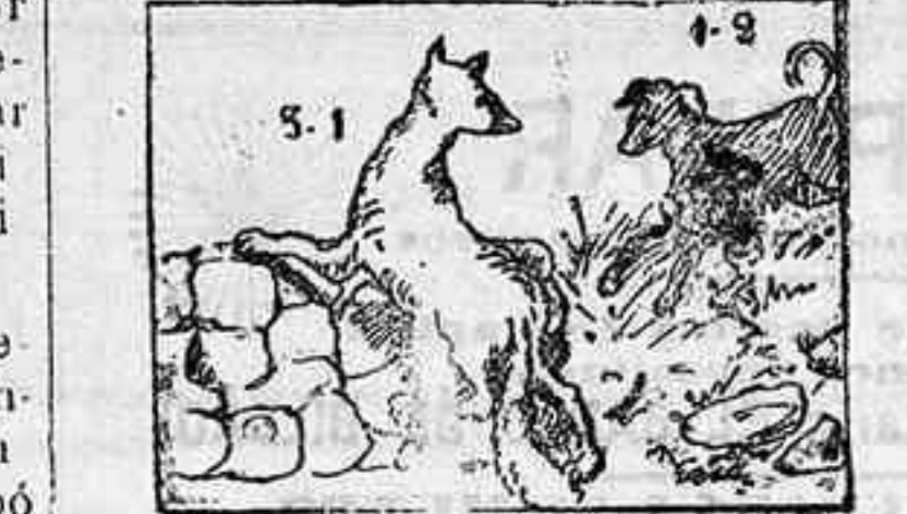
La solución, mañana.