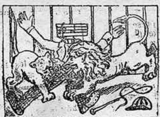
La solución, mañana.