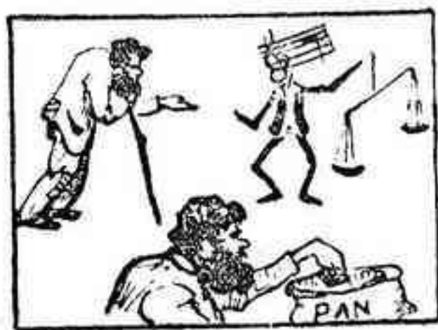
La solución, mañana.