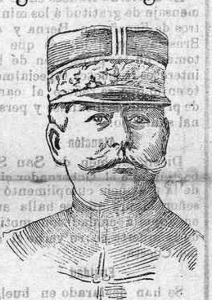
General Sarraill, nuevo jefe del ejército francés en Oriente.