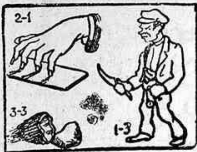
La solución, mañana.

Solución al Problema con puntos, que publicamos el sábado.