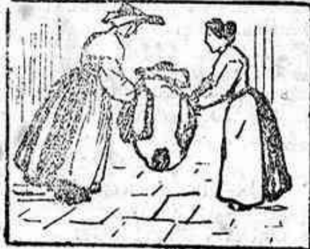
La solución, mañana.