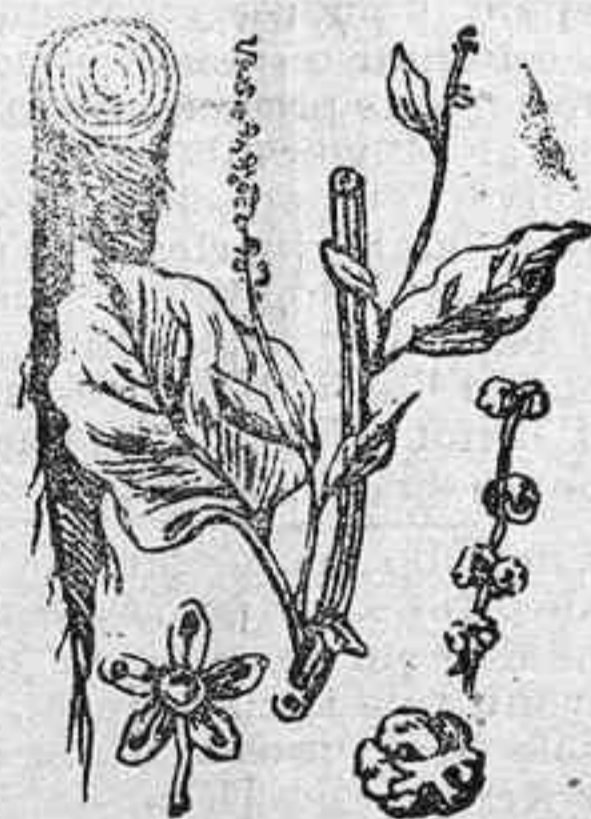
Las raíces forrajeras.—La remolacha

El cultivo de las raíces forrajeras se multiplica de día en día. Los agricultores han comprendido perfectamente que más que ciertos cereales y los pastos es conveniente el cultivo de las remolachas, zanahorias, nabos y otras raíces forrajeras, que, por su volumen, peso y materias nutritivas que contienen, producen mayores rendimientos.