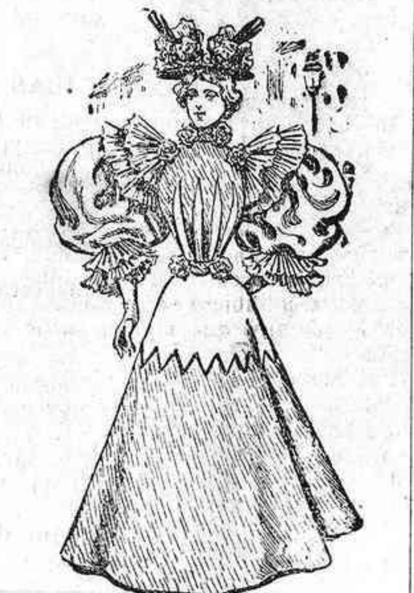
Materiales: 4 metros de cachemira, y 8 metros de crespón.

Gauntes de Suécia, negros, naturalmente. Sombrero de paja guarnecido con adornos de crespón blanco, lazos de crespón negro, y plumas, negras también.