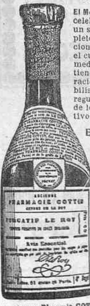
Ancienne Pharm e COTTIN, gendre de LE ROY BOURNIER, Ph m , Succ r , 51, r. de Seine, Paris.

El Método Purgativo LE ROY celebre desde ya mas de un siglo, es de éxito completo contra las alteraciones que se producen en el curso de todas las enfermedades que, en general, tienen por origen una alteración de la sangre, de la bilis, modificando así la regularidad en el trabajo de los órganos: tubo digestivo, hígado reno.