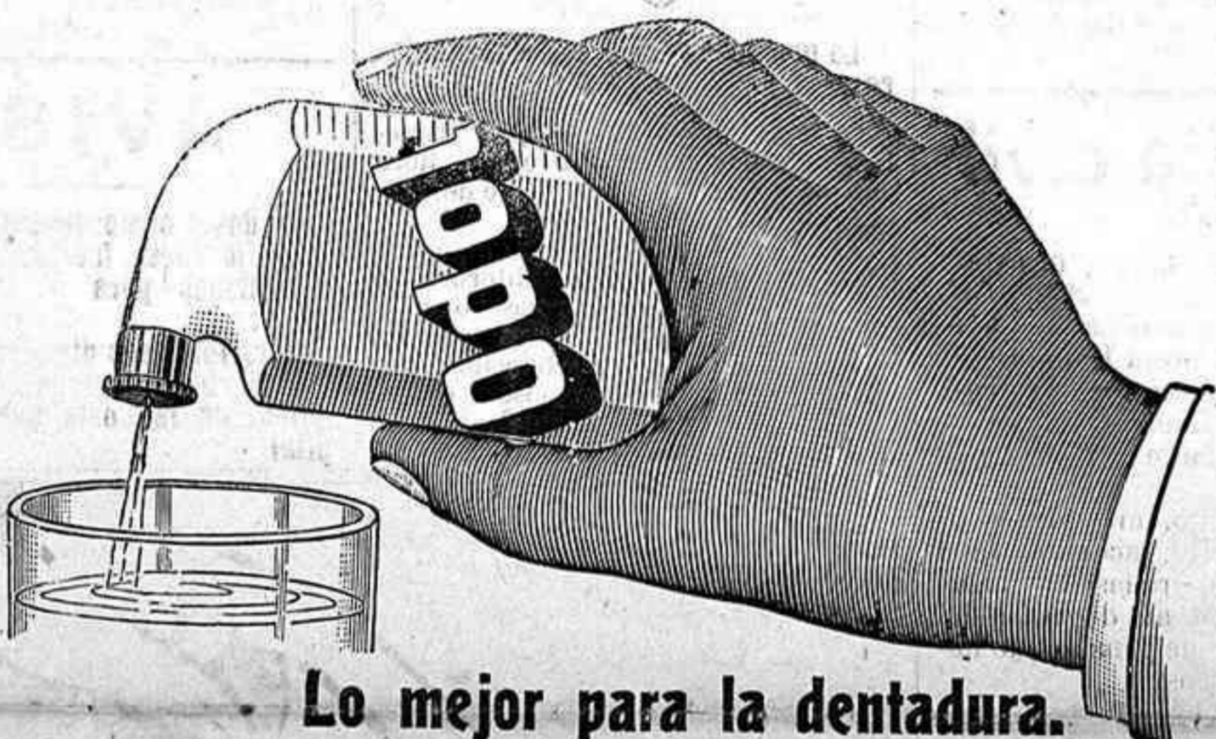
Lo mejor para la dentadura.

Si como es de esperar, no cree lo primero, ni lo segundo acepta, no me es posible llegar