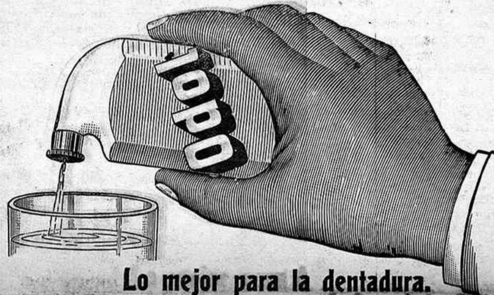
Lo mejor para la dentadura.

Se han recibido despachos de New-York dando cuenta de ha-