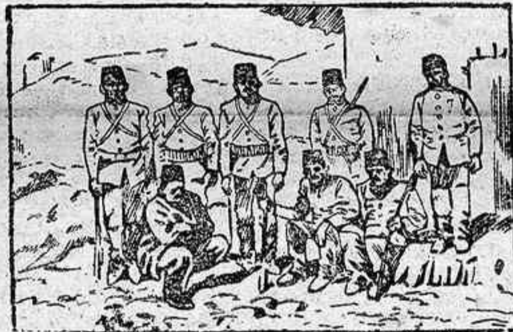
Soldados turcos descansando en un alto

Hamid II. tan preñados de revueltas, insurrecciones y horrores de todas clases, motivados por el absoluto poder de dicho Sultán, que, si ha jurado la amplia constitución que le han impuesto los jóvenes turcos, es de temer lo haya hecho impulsado por el estado de sus tropas, pues mal pagadas y peor equipadas, poco podía esperar de ellas el sombrío soberano.