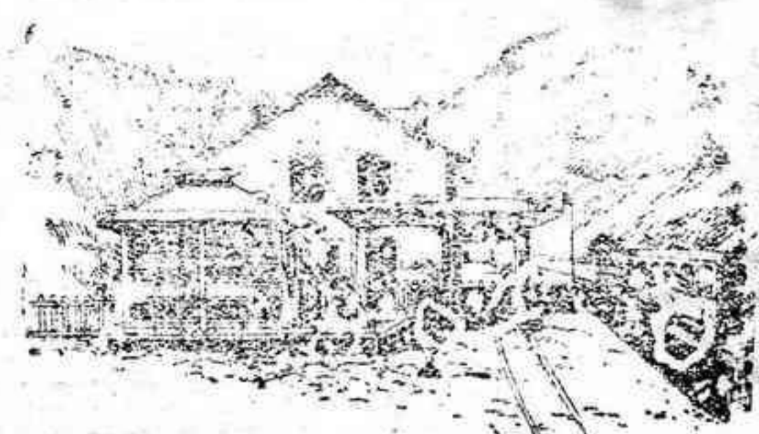
ESTACION DE SALIDA

Por las noticias que llegan hasta nosotros, el dominio de la región alpina de las nieves y de los hielos, con sus cascadas, torrentes y precipicios, no tardará en ser un hecho. Una vía férrea eléctrica remontará al viajero a 4.800 metros de altura. El proyecto de esta vía, debido a un ingeniero francés, no deja de ser sugestivo. Parte el trazado de la estación de Fayet-Saint-Gervais (Monte Blanco) y se efectúa el recorrido al aire libre hasta Mont Lachat. Desde allí hasta la cúspide, por el centro de un túnel, que servirá para proteger la línea contra la furia de los aludes. Al llegar a la altura de 2.640 metros, el convoy recorrerá al aire libre una gran extensión del Monte Blanco y los pasajeros podrán admirar los magníficos panoramas de la región alpina.