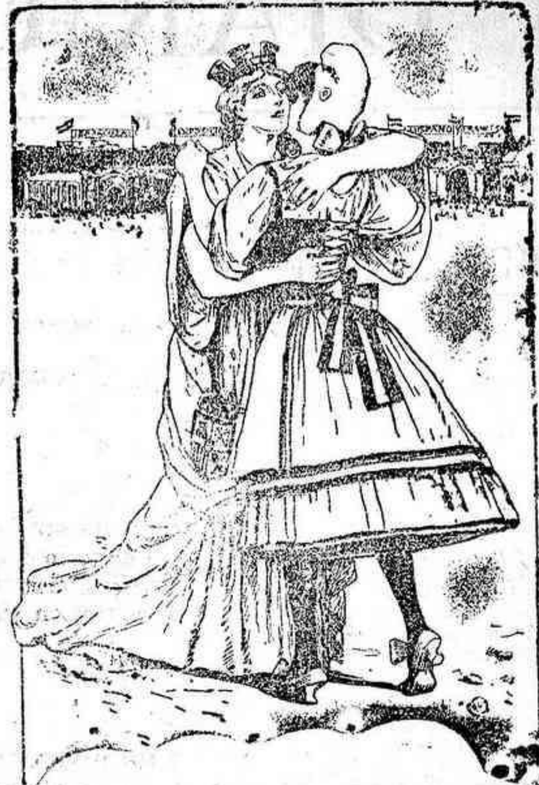
Cien años después

(De «Hojas Selectas» revista para todos)