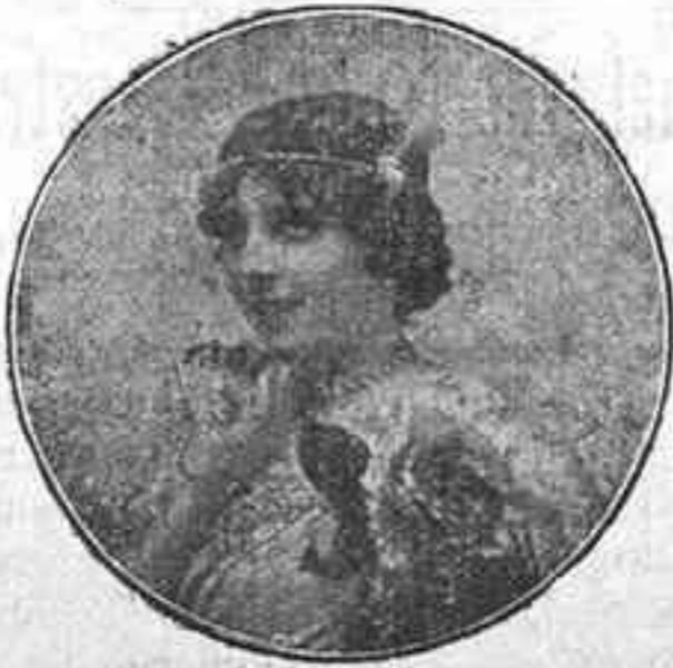
CANZONETISTA MEXICANA-NANA que debutará esta noche.