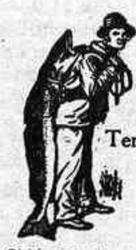
Obténgase siempre la Emulsión con esta marca "El Pescador", marca del procedi- miento Scott!