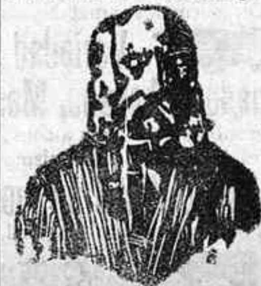
A. Charles Lambert—Paris. Depósito general Calle Balmes número 106, Barcelona

El eminente doctor Charles Lambert, de París, después de un profundo estudio sobre las enfermedades venéreas y sífilíticas ha encontrado el medio de curarlas radicalmente, no solo sin hacer uso del MERCURIO, sino que combate las enfermedades contraídas por el uso de dicha sustancia. El tratamiento es sencillísimo y las fórmulas son puramente vegetales, pues en su composición solo entran hierbas minerales de la India. Estas fórmulas las presenta en las formas siguientes: Las Píldoras Charles Lambert, que curan las purgaciones, estrecheces de la uretra, flujo blanco de la muger, y gota militar. La Inyección Charles Lambert, que debe de usarse al mismo tiempo que las píldoras para que la curación sea más radical y pronta. El Elixir Charles Lambert es un gran medicamento, eficazísimo para la completa destrucción de todo bacilo sífilítico. Con su uso se purifica la sangre impura, dejándola en su estado normal, libre de todo virus, dando salud é inmunidad para evitar la reproducción de tan terrible enfermedad. Este Elixir debe de tomarse como complemento del tratamiento, una vez que los efectos, ó sea la purgación haya desaparecido. Precio de las Píldoras, pesetas 4'50. La Inyección, pesetas 3'80 y el Elixir 3'80.—De venta en Santa Cruz de Tenerife (Canarias), en la farmacia de Serra, calle del Castillo número 7. Para cualquier duda que se presente consúltese por escrito al inventor, calle Balmes, 106, Barcelona.