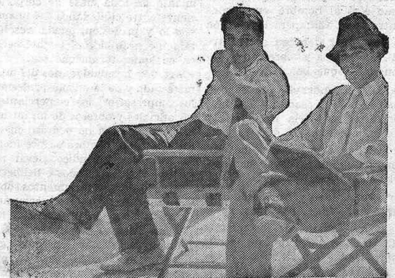
Con el libro-guion de escena sobre los muslos, Richard Boleslawsky, el joven y ya popular director, asiste a la impresión del film, acompañado de su ayudante.