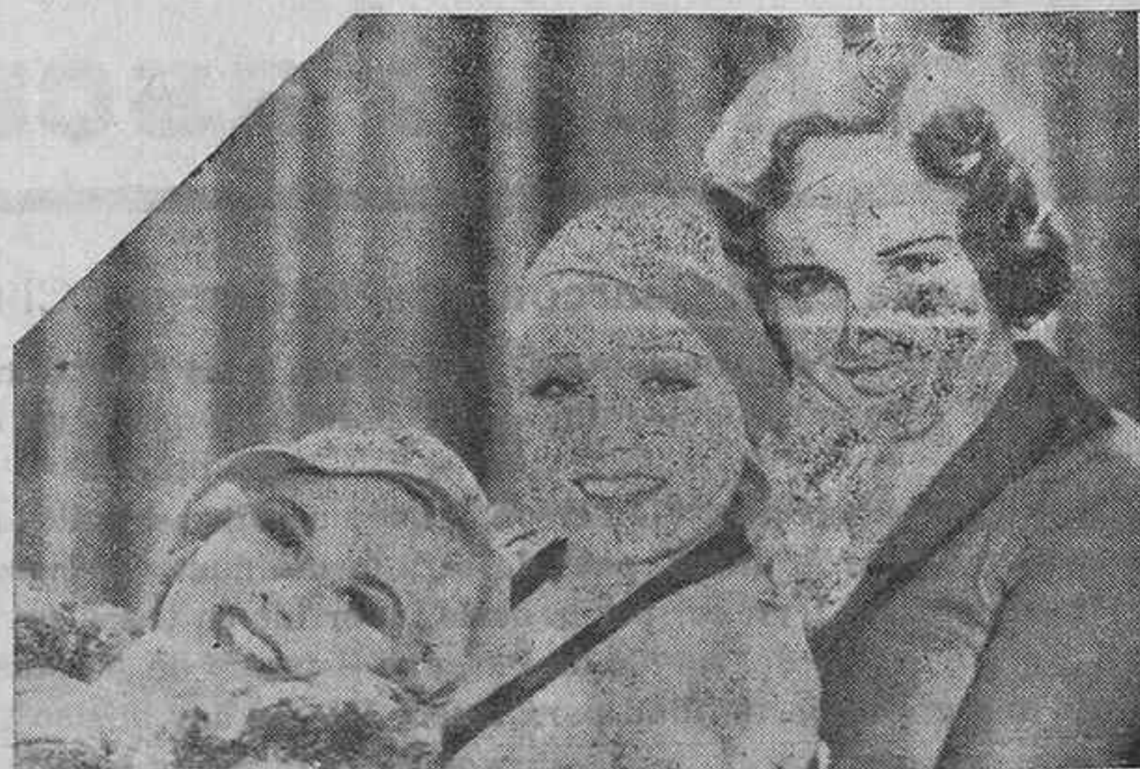
He aquí un simpático grupo formado por tres "estrellas" del cinema, Joan March, Anita Page y Magde Evans.