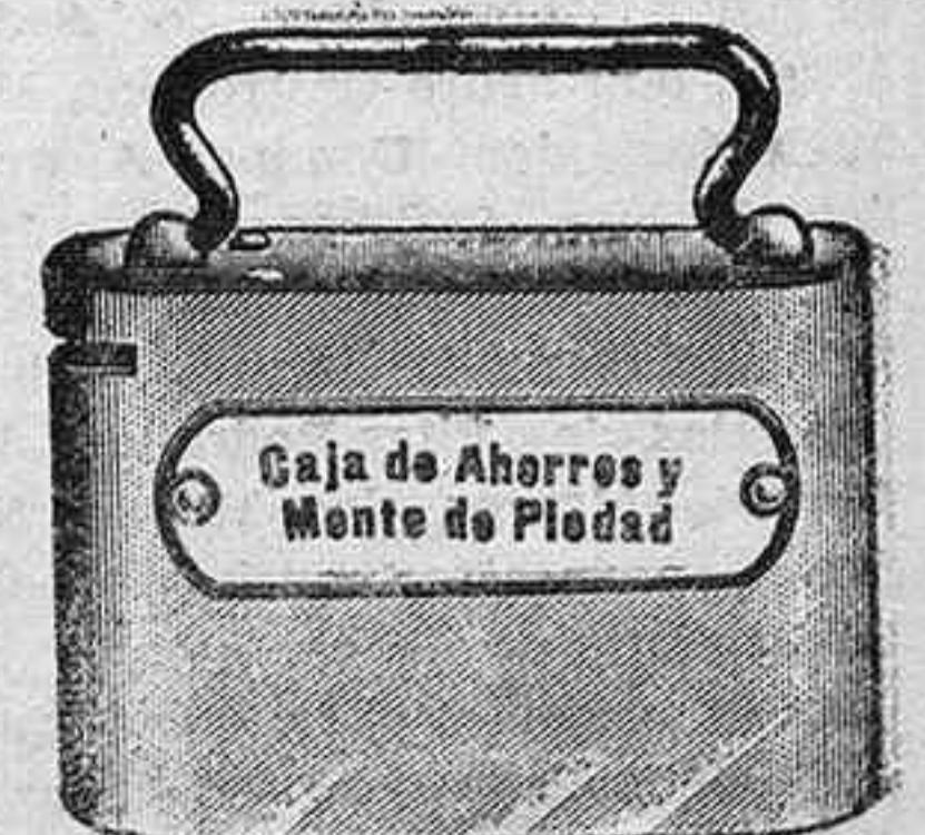
Caja de Ahorros y Monte de Piedad