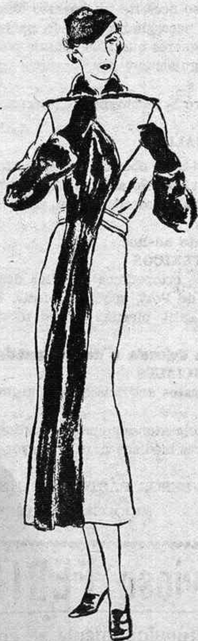
ABRIGO DE ESTACION

Después se hace el llado de ella a fuego dulce y con la crema, procurándose que al llegar a la mesa, conserve su calor y pueda en esta disposición agregarse al plato que haya sido previamente preparada para esta salsa americana.