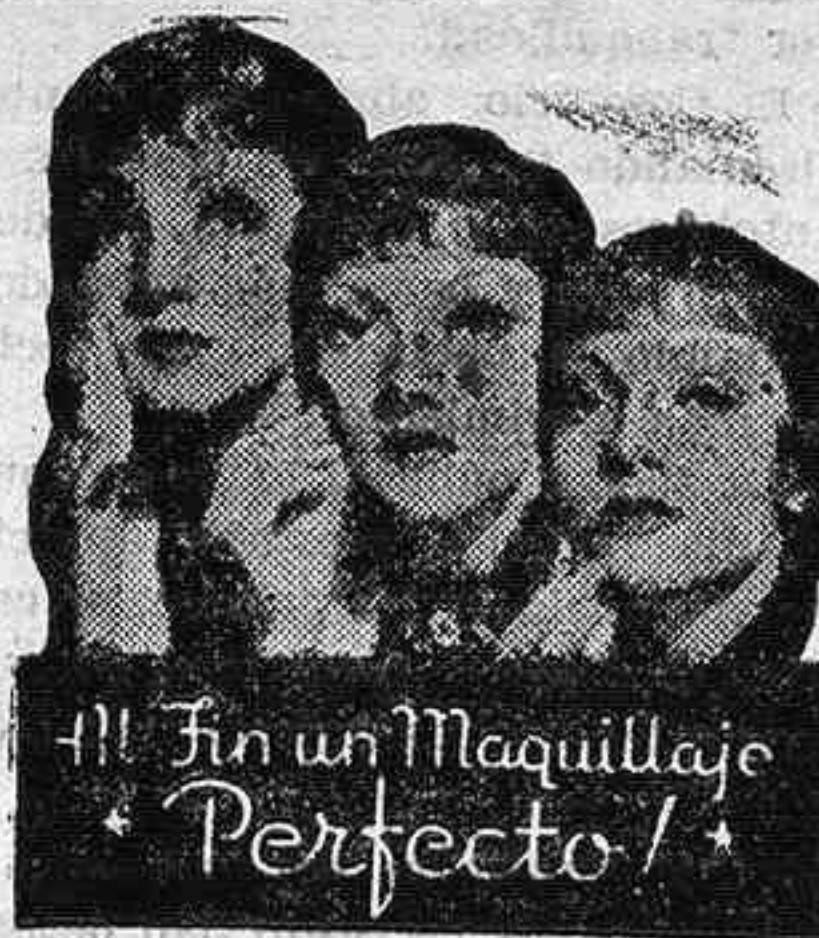
DEMONSTRACION POR CLAUDETTE COLBERT

Los mineros que trabajan en el salvamento declararon que es imposible resistir las emanaciones y el calor que se nota en la mina.