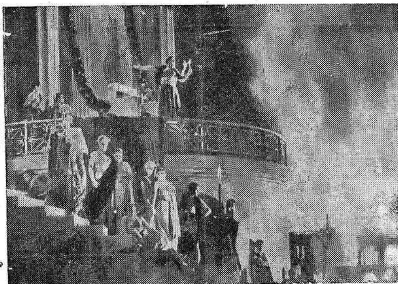
LA ROMA DE AQUELLA EPOCA LEJANA, CON EL CIRCO Y SUS GLADIADORES Y, FINALMENTE, CON SU TOTAL INCENDIO, APARECE EN UNA NUEVA VISION HECHA POR CECIL B. DE MILLE ALLA EN HOLLYWOOD.