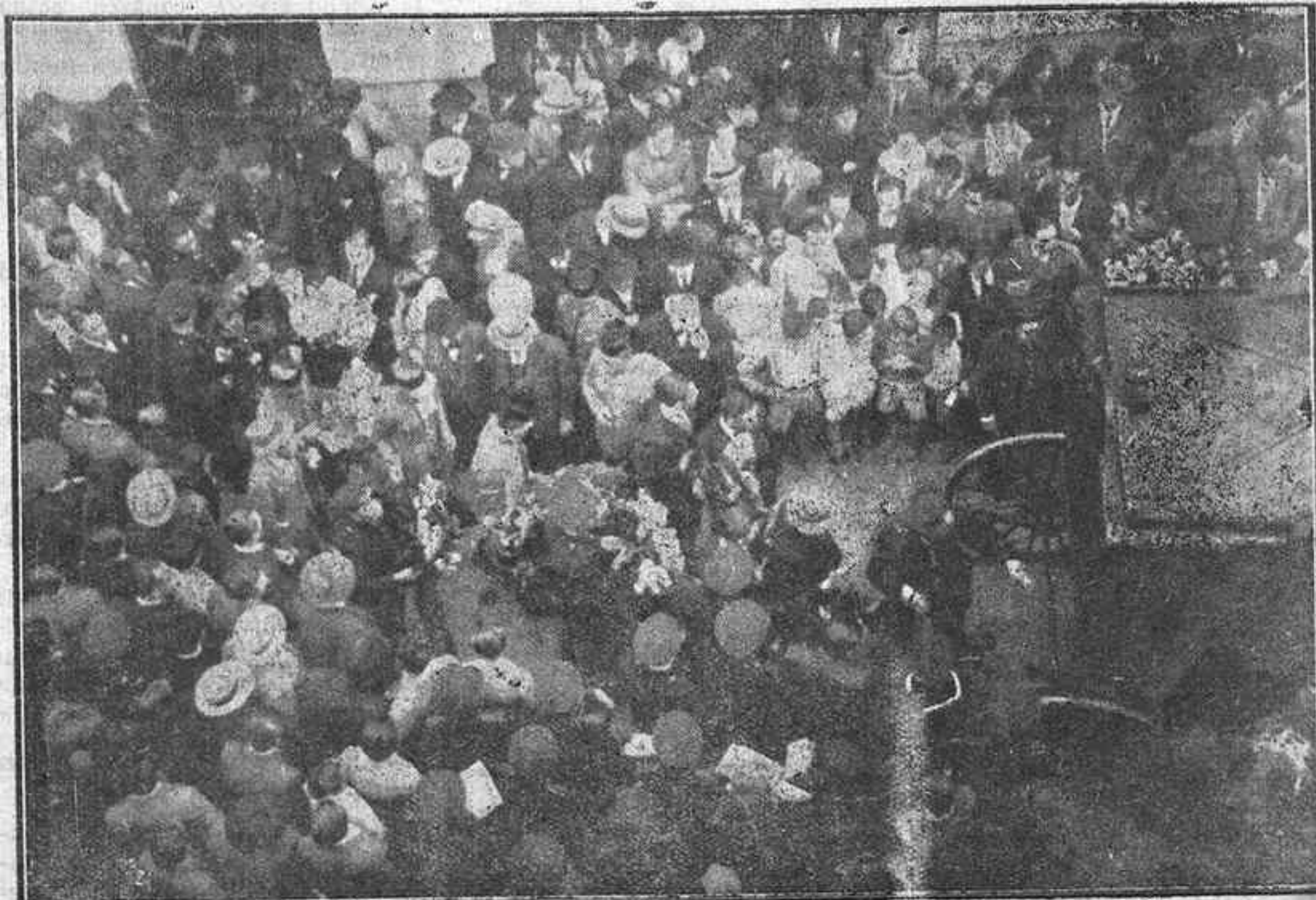
ASPECTO QUE OFRECIA LA COMITIVA FUNEBRE AL EMPEZAR EL RECORRIDO, FRENTE AL CUARTELILLO DE LOS GUARDIAS DE ASALTO.—LOS COMPAÑEROS DEL INFORTUNADO QUE TIENEN EL CONSUETO DE ACOMPAÑARLO CARGANDO SENDAS CORONAS OFRECIDAS POR OTROS CUERPOS DE VIGILANCIA.

En la presidencia del duelo figuraban el gobernador civil, comandante militar de Canarias, presidentes de la Mancomunidad y de la Audiencia, alcalde de esta