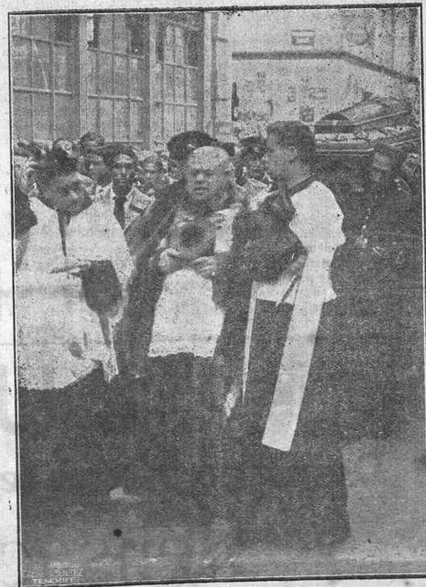
UN DETALLE DEL PASO DE LA COMITIVA AL DOBLAR LA ESQUINA DE FERMIN GALAN Y CALLE NORTE, EN DONDE PUEDE VERSE EL ATAUD EN HOMBROS DE SUS COMPAÑEROS.—EN PRIMER TERMINO EL CLERO.

Unión, unión fuertemente hecha; con entusiasmo, con valor, con recursos económicos, con aportaciones personales, hace falta aquí en Tenerife, en toda la provincia. Que nadie se esconda y que nadie escatime. Vamos todos al triunfo.