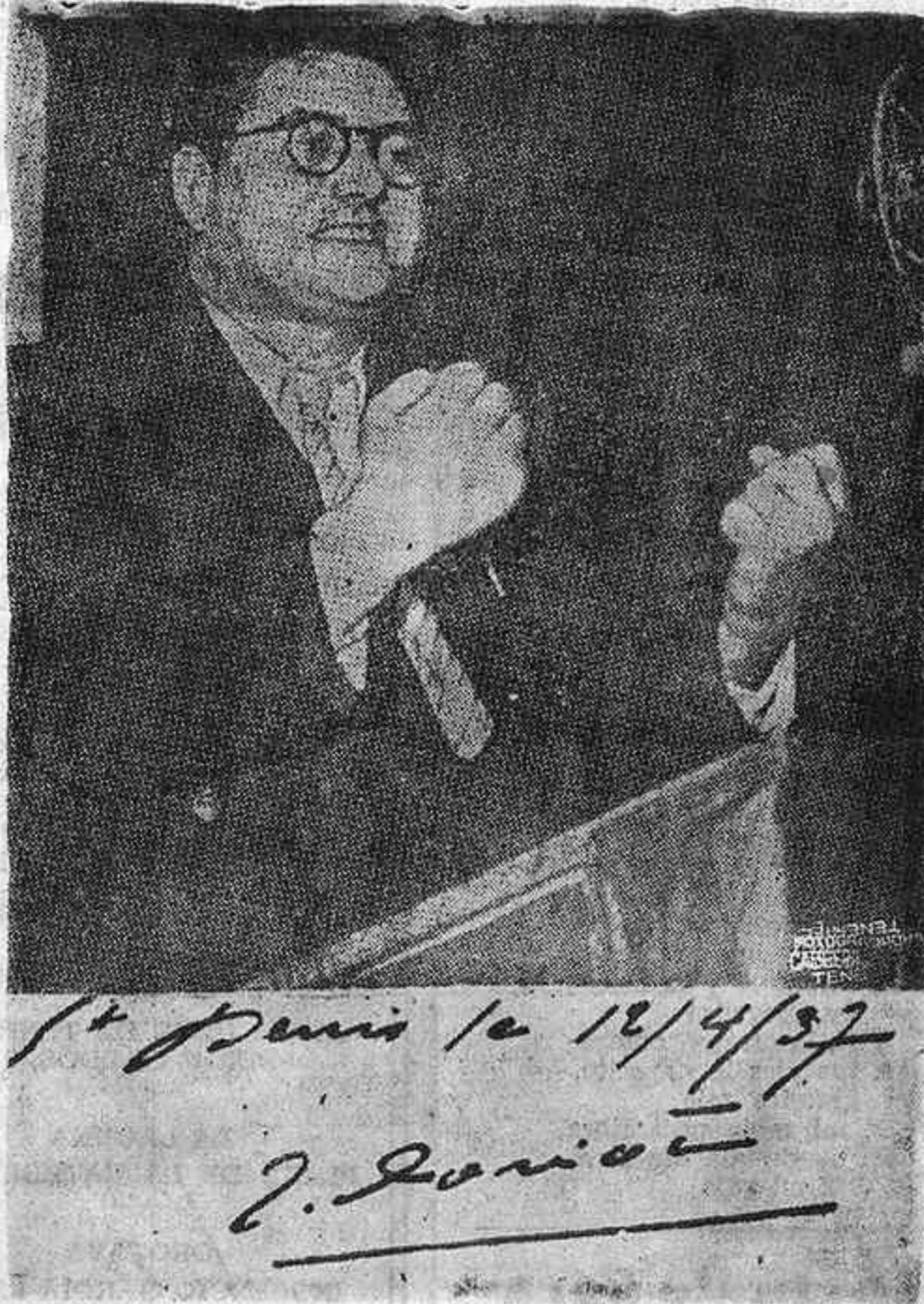
Jacques Doriot, el alcalde de Saint Denis y jefe del Partido Popular Francés, antiguo comunista y hoy el adversario más formidable del Frente Popular Francés