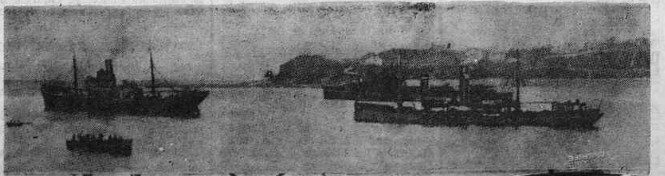
Los tres barcos ingleses cargados de víveres que rompieron el bloqueo de Bilbao el 23 de abril, gracias a la cooperación de la Marina de Guerra inglesa.

(Nombres, fechas y datos obtenidos del "Daily Mail" y del "Morning Post" del 22 al 26 de abril.)