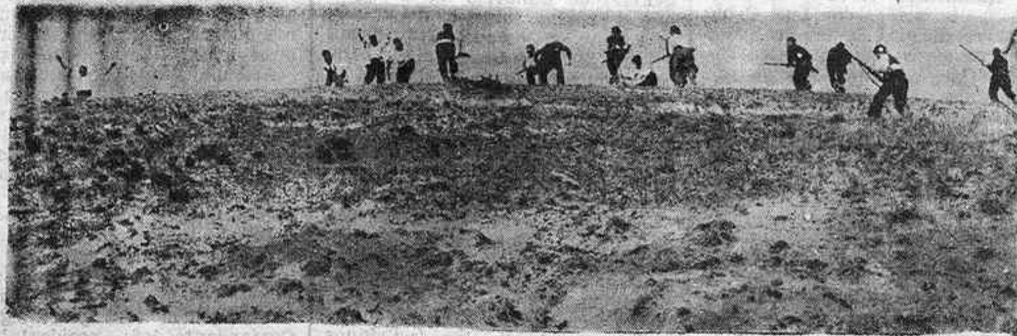
Tropas nacionalistas tomando un cerro