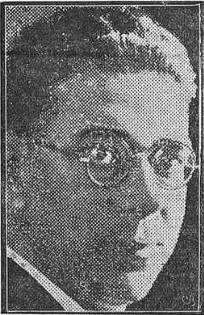
Hendaya, 24. En los círculos políticos y militares nacionalistas se habla con insistencia de que el Generalísimo

Se asegura que el Gobierno nacionalista que se ha de constituir después de la entrada de las fuerzas nacionalistas en Madrid, será presidido por el general Mola.—Las carteras de Estado, Hacienda y Obras Públicas las desempeñarán elementos civiles