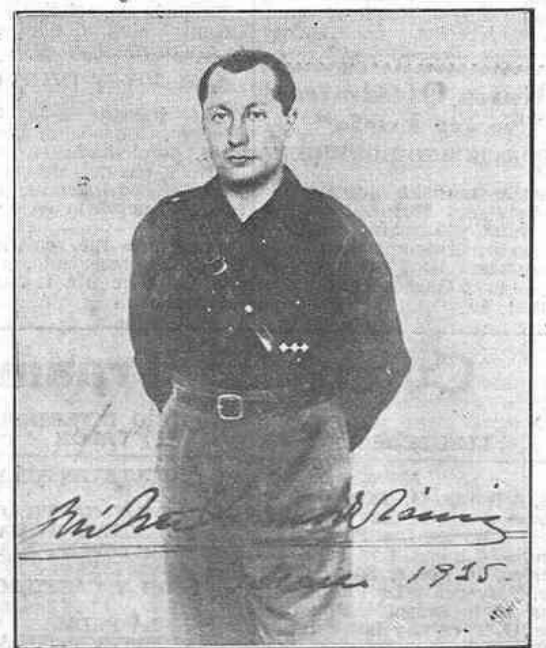
Por acuerdo del Ayuntamiento de esta capital, en sesión celebrada ayer tarde, y a propuesta de Falange Española, la Avenida Marítima se llamará "Avenida de José Antonio Primo de Rivera"

"Tenga prevista línea alto Redilluero, alturas tras Canseco, alturas tras Villanueva de Ponteduro... que no deje una casa sin quemar".