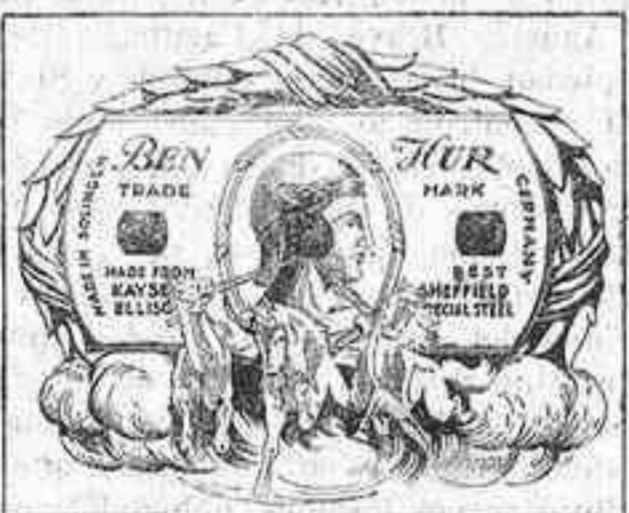
La mejor Hojilla de afeitar. VENCE A TODAS. Pruébela y no usarás otra.

Motors trifásicos de alto rendimiento, elevada potencia efectiva, reducido consumo de corriente y precio económico. CASA SIEMENS, San José, 13.