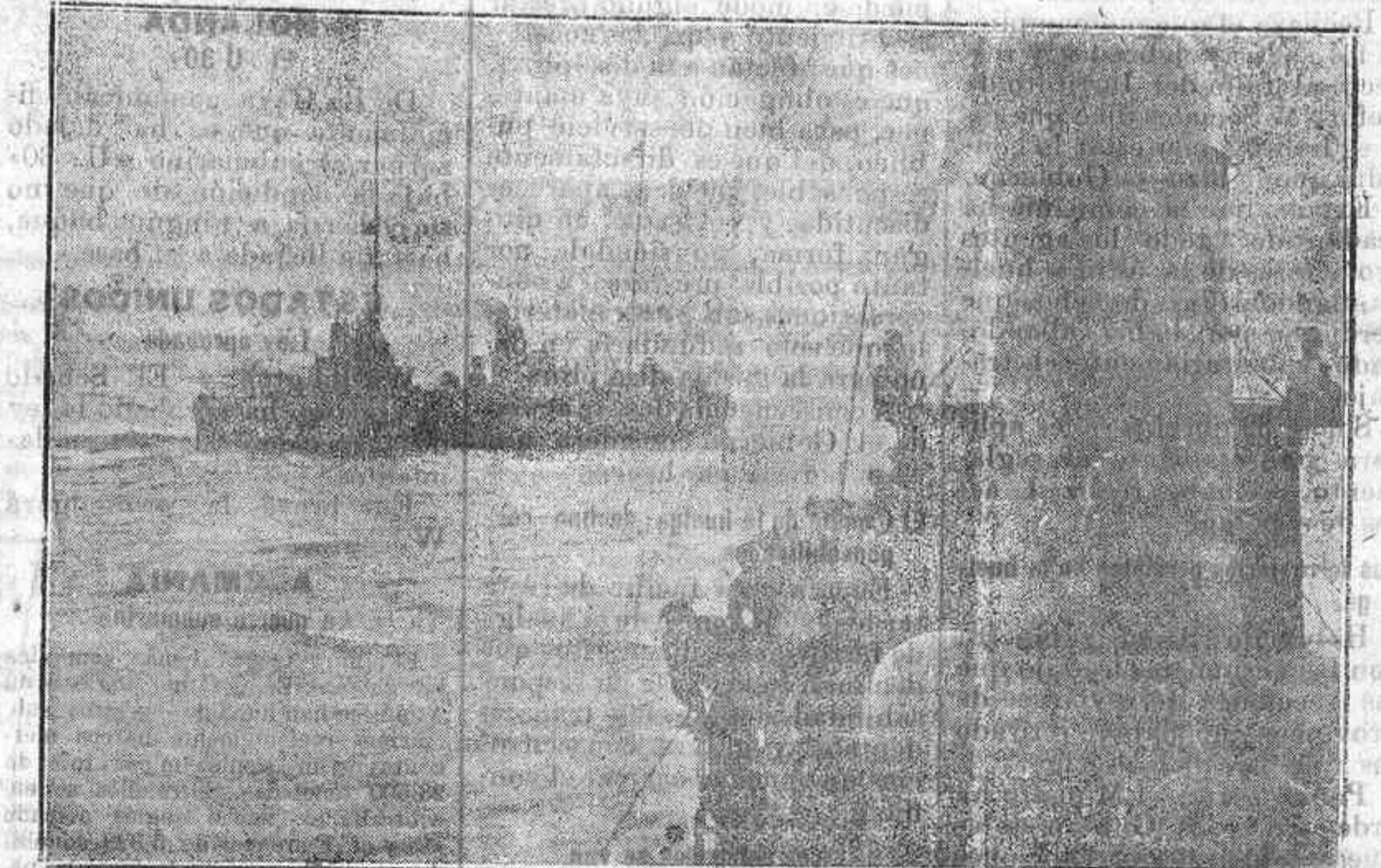
Una escuadra alemana.—Torpederos en maniobras