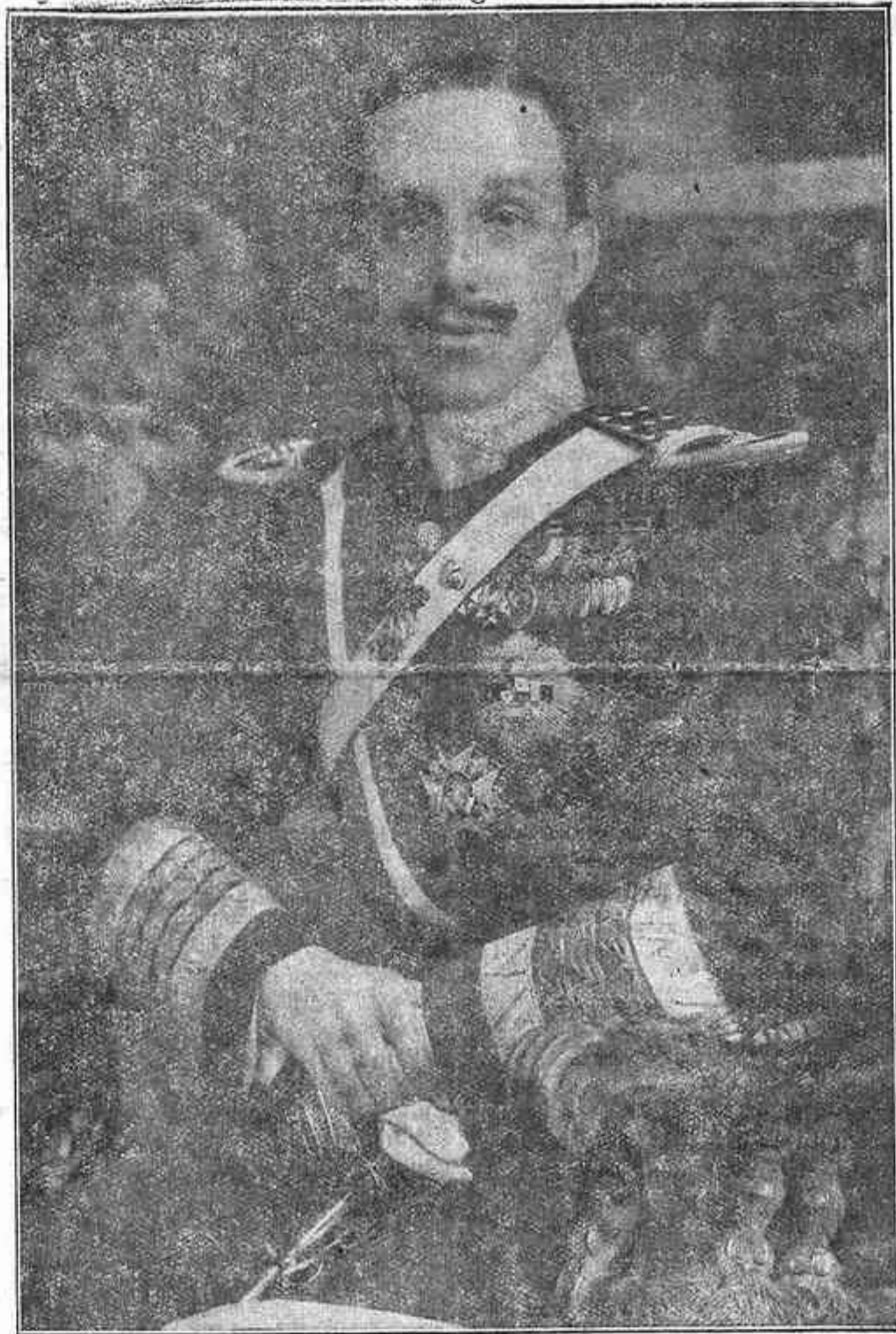
Nuestro popularísimo Monarca don Alfonso XIII, que hoy celebra su fiesta onomástica

Desde este españolísimo rincón de España—la noble tierra linférica—quiere hoy el cronista poner, una vez más, sus íntimas convicciones monárquicas en leal adhesión a nuestro popularísimo Monarca en el día de su Santo; que este es el momento propicio para que públicamente se adentren los españoles por las ideologías que más convienen a nuestra Patria, en oposición decidida y entusiasta a todo