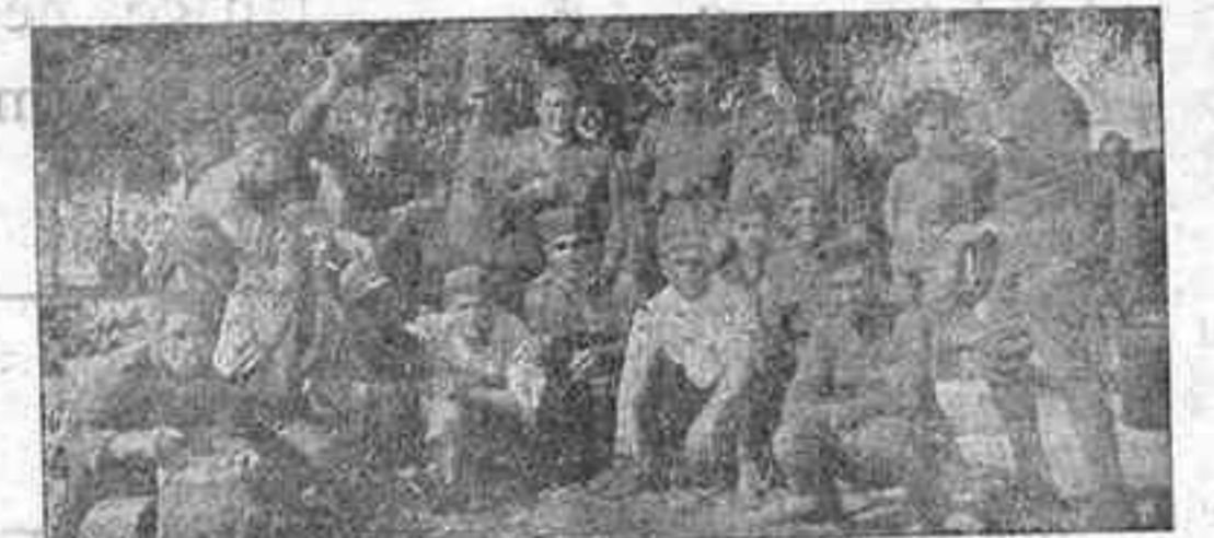
Rancheros del batallón de Tenerife, en uno de los descansos de las marchas, apenas llegados a tierras de Yebala.