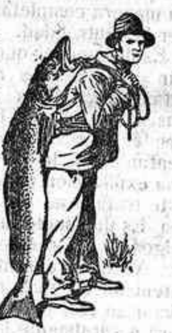
Marca de fábrica.

Es un contrasentido confiar la salud de los hijos a remedios de baja calidad cuando la Emulsión SCOTT no ha cesado de curar durante 40 años donde todo otro remedio ha resultado inútil.