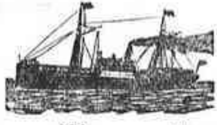
El magnífico vapor

que saldrán de Santa Cruz de Tenerife para los puertos que á continuación se expresan: