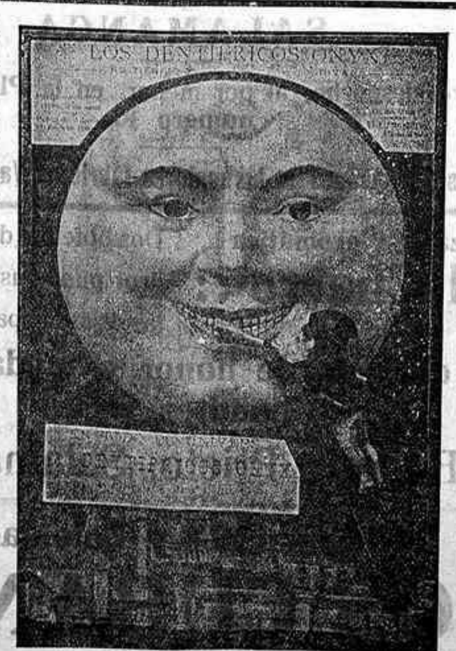
Jabón y Crema ONYX

¿Hay algo más desagradable y nocivo que una boca descuidada?