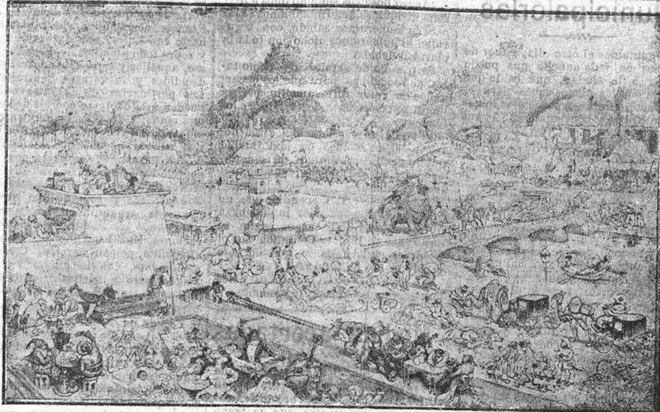
La caricatura extranjera.—Delicioso aspecto de la vida en Egipto cuando los alemanes logren libertarle del yugo inglés

Pero ese odio, ni los alemanes lo sienten por Inglaterra ni los ingleses tienen fundamento para sentirlo hacia Alemania. Lo que ocu-