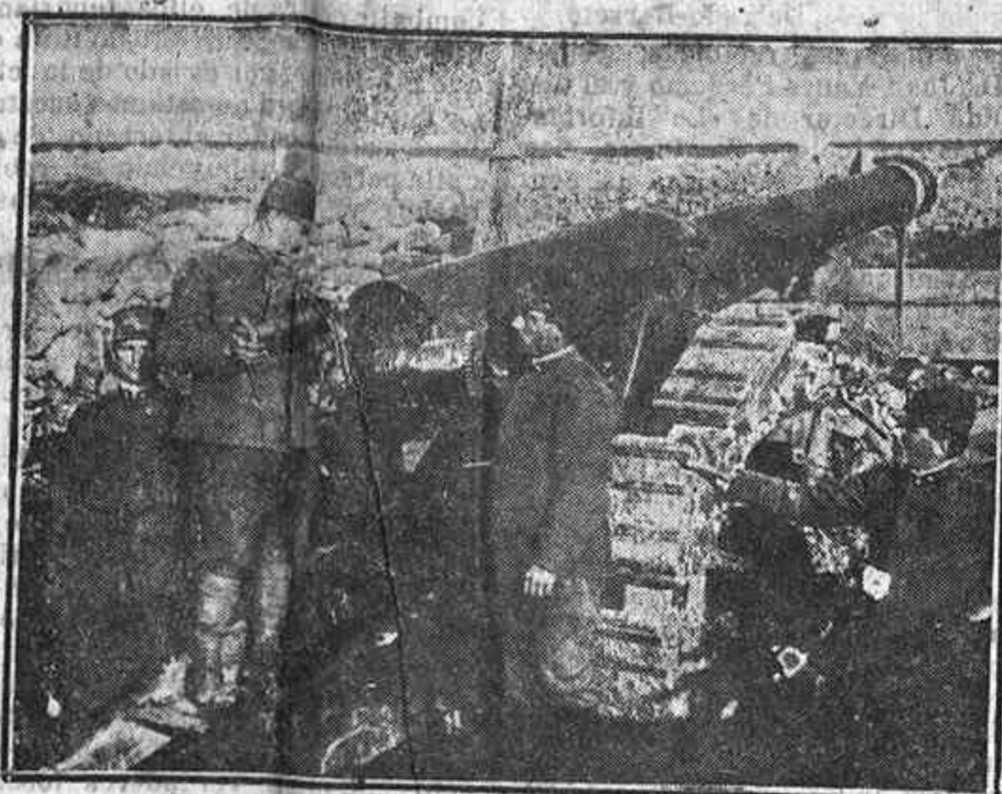
Pieza de artillería austriaca preparada para un cañoneo en el frente italiano

Nuestro folletín, será siempre perfectamente encuadrable.