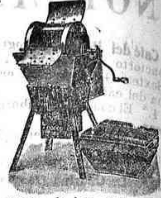
Máquina de lavar Todo Vapor

Útil a todos: desde la familia más reducida hasta los más grandes establecimientos