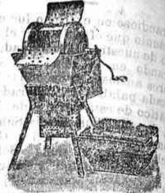
Máquina de lavar Todo Vapo

Desde la familia más reducida hasta la más grandes establecimientos