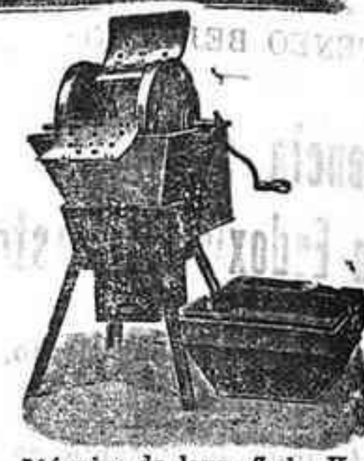
Máquina de lavar Todo Va

¡Y! a todos: desde la familia más reducida hasta la más grandes establecimientos.