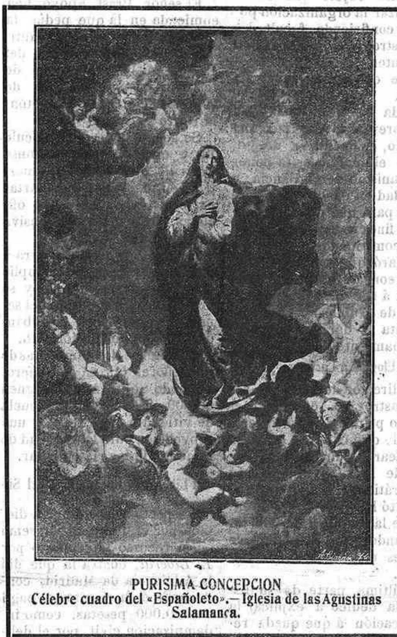
PURÍSIMA CONCEPCIÓN Célebre cuadro del «Españoleto».—Iglesia de las Agustinas Salamanca.

Y no fué sólo el pueblo sino el virtuoso prelado señor Fernández de Córdoba quien, haciendo suya aquella creencia, declaró ser de precepto para toda la dió-