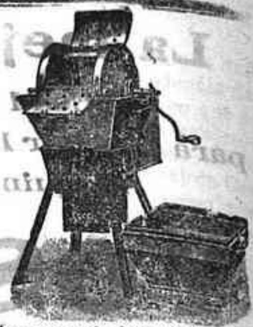
Máquina de lavar tipo 7 y 8

Útil a todos: desde la familia más reducida hasta los más grandes establecimientos